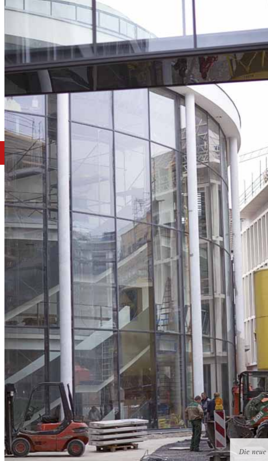
Die neue Theaterfassade

Als Freilichtaufführung im Schlos-sinnenhof in Schloß Neuhaus steht die „Die schlaue Susanne“ von Lope de Vega, „dem spanischen Shakespeare“ zum Abschluss der Spielzeit auf dem Plan. Im neuen Studio gibt es ein spannendes, zeitgenössisches