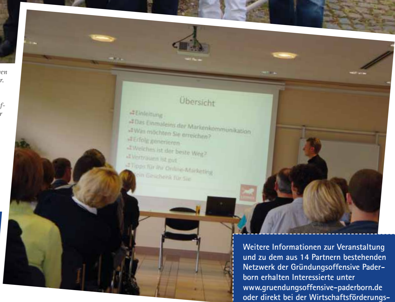
Impression des Informationstages

(tp) Beim 21. Informationstag der GründungsOffensive Paderborn freuten sich die beiden Gastgeber TechnologiePark-Gesellschaft und Wirtschaftsförderungsgesellschaft Paderborn über ein volles Haus: Fast 100 Interessierte nutzten die Chance, Neues zum Thema „Internet ist mehr als Homepage“ zu erfahren.