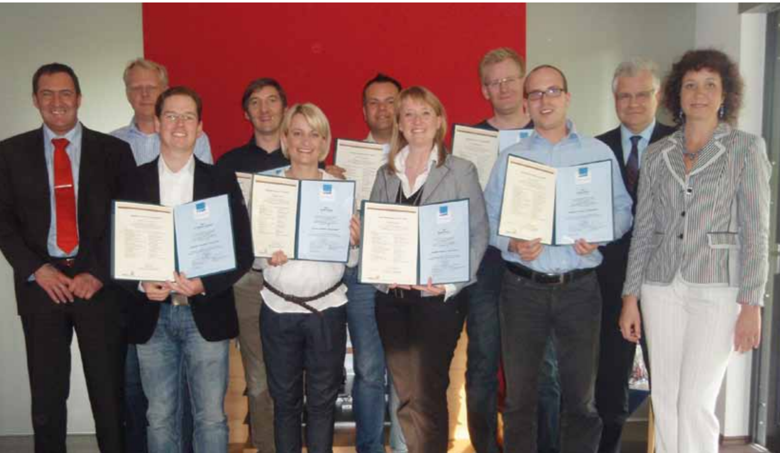
Die zertifizierten Fachtrainer BDVT