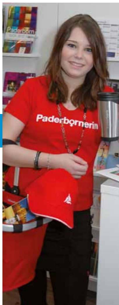
Kaffeetassen, Hüte, T-Shirts, Einkaufstaschen und vieles mehr in Ihrer Tourist Information

Die Artikel können bequem im Internet unter www.paderborn-shop.de bestellt werden. Viele sind auch in der Tourist Information am Marienplatz vorrätig. ■