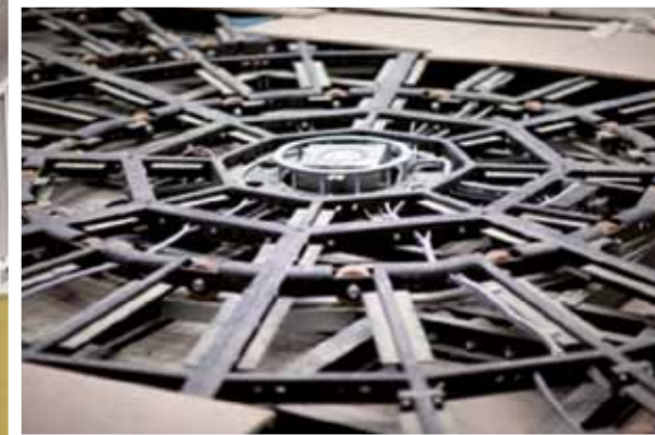
Skelett der Drehscheibe

Kammerspiele den Zuschlag bekommen haben, im Mai 2012 das Kinder- und Jugendtheatertreffen NRW „westwind“ auszurichten dürfen. Ein ganz besonderes Ereignis werden auch die Vorstellungen von „Das weiße Zimmer“ (Titel in China: „Long Ya“ – Drachenzahn) von Andreas Sauter sein.